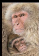
24 Mère & fille