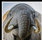
7 Défense d'Ap...