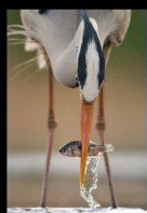
22 La pêche du...