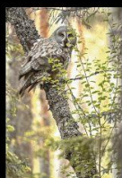
14 Epervière br...