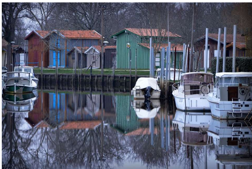
Port de Biganos

Organisée par le Photo-Club du Val de l'Eyre à Biganos (33) pour la Fédération Photographique de France, cette compétition aura lieu du vendredi 13 février au dimanche 15 février 2026.