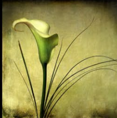
17 PIRES-DIA_Le doux parfum de mon arum