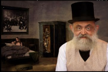
5 DEVERS_the closed