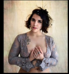
4 DELAURAT_grâce 4