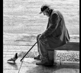
16 PEDELMAS_Le rendez vous