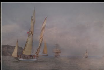
26 Christian Blondel-La granvillaise