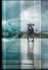
10 LABRUYERE_sous la pluie