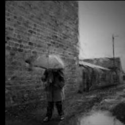
11 LAINÉ_Passage du parapluie