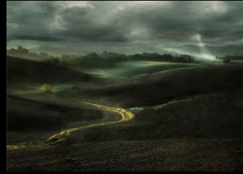
3 DE MORANGIS_sans titre