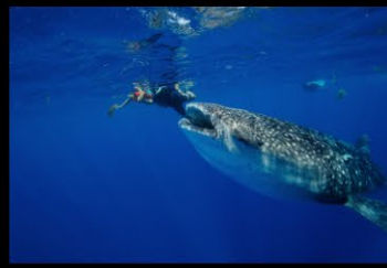
19 SIMON_requin baleine