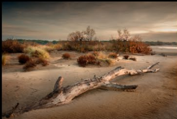
13 LAUSSEL_automne en camargue