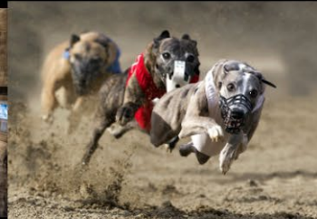
23 VAN EENNO_Ventre à terre