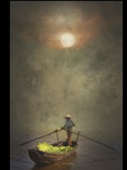
24 André Torres Mékong sous la brume