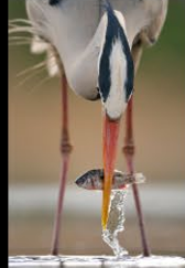
18 POINSIGNON_héron cendré perché