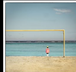
27 Francis décroix-le but