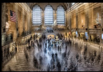
22 TRIGALOU_grand central