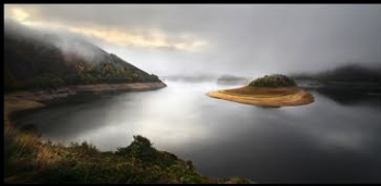
9 HOURIEZ_Cirque de Mallet