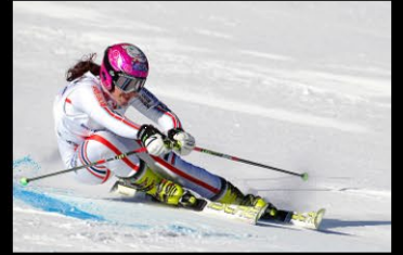
8 DZIURLA_sans titre