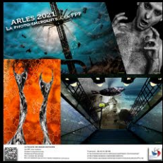
affiche ARLES 2021 WEB