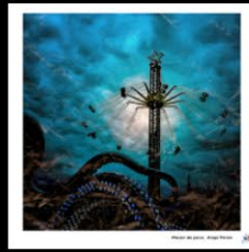
N°1 Plaisir de peur, Ange Perez