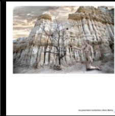
N°9 La première tentation, Jean Banq