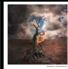
N°21 Renaissance, Youssef Chennoufi