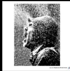
N°13 Le cri, Stéphane Bretonneau