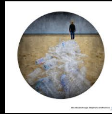
N°2 Em-Bouteil-Age, Stéphane Anthonioz