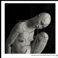
N°12 East side of the cloud, Gilbert Amgar di Aa...