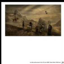
N°24 Le déconfinement du 11 mai 1353, Jean-M...