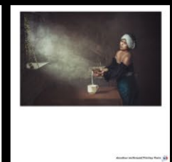
N°28 Another milkmaid, Tinley Paris