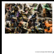
N°19 La nature outragée, Alain Roeland