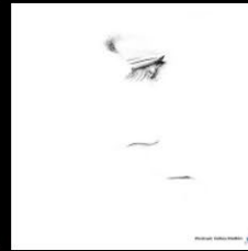
N°8 Portrait, Gilles Halbin