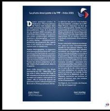
Présentation expo Arles 2021