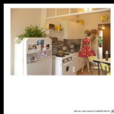
N°25 Ma vie, mon oeuvre, Isabelle Faivre