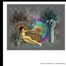
N°20 Vénus à la manière de..., Claude Mesnier