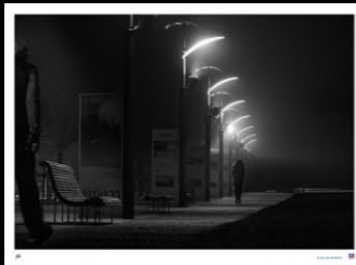
13 La proie, Laurence Meynard