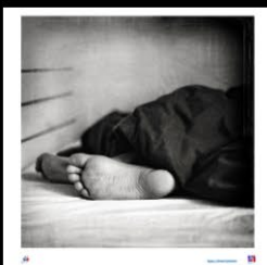
20 Repos, Christel Vérillotte copie