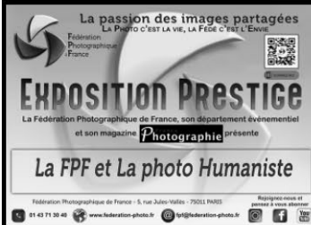
Panneau FPF et la photo Humaniste