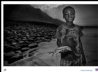
17 Offrande, Fernand Domange